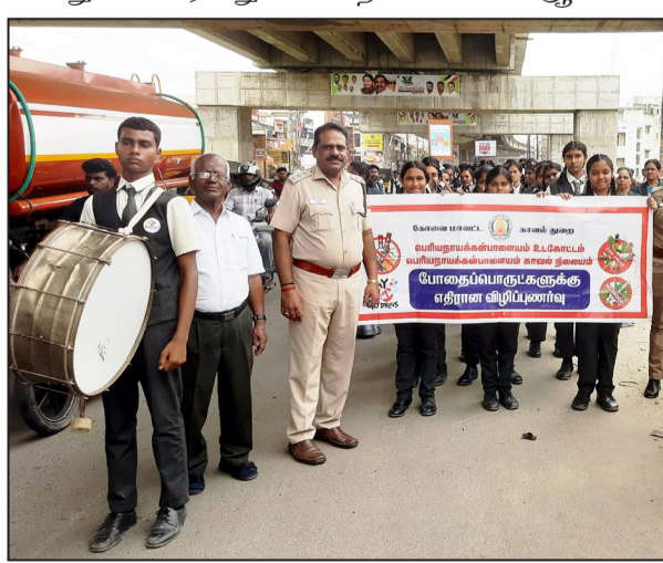
கோவை பெரியநாயக கண்பாளையத்தில் போதைப்பொருள் பயன்படுத்துவதை தடுத்தல் குறித்த விழிப்புணர்வுப் பேரணி நடைபெற்றது.