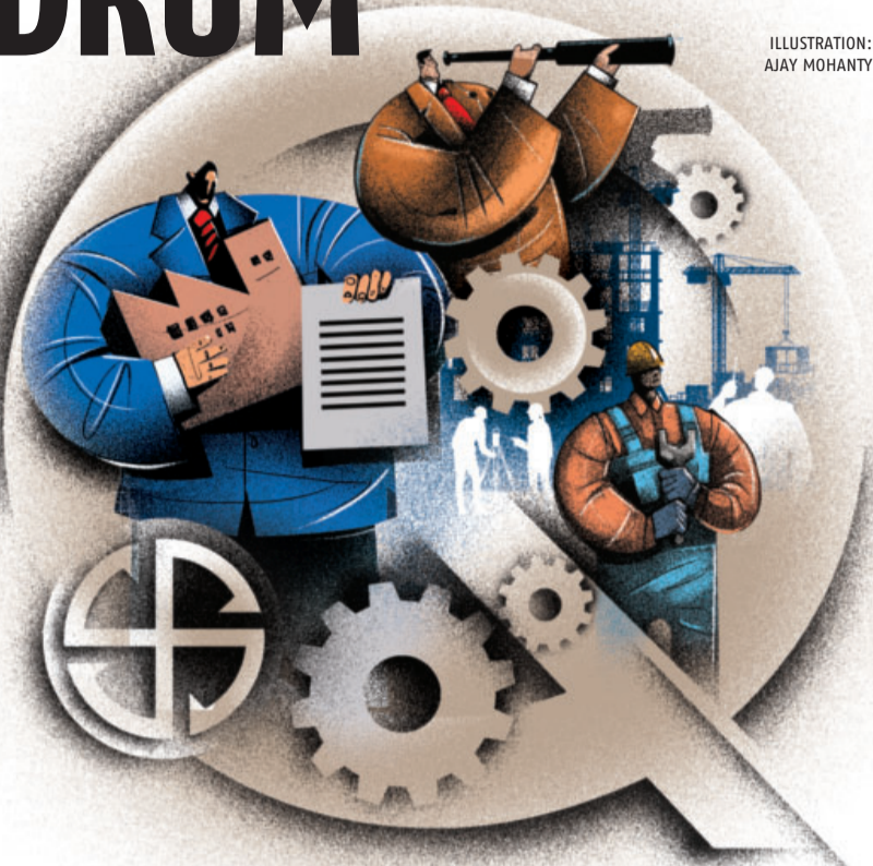
ILLUSTRATION: AJAY MOHANTY

Similarly, in the first quarter of FY15, which saw a transition from the Manmohan Singh government to the Narendra Modi regime, the economy grew by 8 per cent, marking the highest quarterly growth in the new