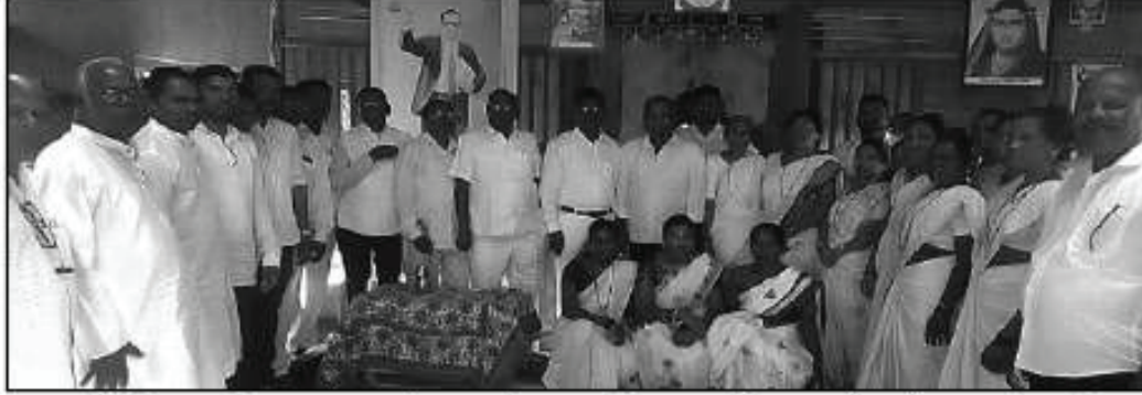
चवे येथील वृद्धदिवंगार पार पडलेल्या वर्षावास कार्यक्रमात उपस्थित भारतीय बौद्धमहासभेच्या जिल्हा शाखेचे पदाधिकारी तसेच गावशाखेचे पदाधिकारी व सदस्य.

मंडणगड इथे झालेल्या पत्रकार परिषदेत त्यांनी आम्हाला सर्वांना सोबत घेवून जायचं आहे असं वक्तव्य केले आहे. शिवाय ज्यांच्याकडून चुका झाल्या त्यांनाही बरोबर घ्यायचं आहे असं ते म्हणाले. लोकसभा निवडणुकीत विरोधकांना मताधिक्य मिळालं म्हणून त्यांनी हारवून जायचं आहे. विधानसभेला योगेश कदम हे साठ हजार मतांनी निवडून येतील असे रामदास कदम म्हणाले. लोकसभेला मुस्लिम समाज नाराज होतो. दलित समाजाने संविधानामुळे शिरोधात मतदान केले. तर कुणबी समाजाने गिरेना पाठिंबा दिला. पण ही स्थिती विधानसभेत राहणार नाही. विरोधकांनी दापोलीत विजय मिळवण्याचे स्वप्न पाहू नये असं ते म्हणाले.