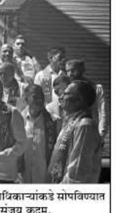
दापोली मतदारसंघात शिवसेना ठाकरे गटातर्फे प्रचाराची जबाबदारी विविध पदाधिकाऱ्यांकडे सोपविण्यात आली. याप्रसंगी नियुक्ती पत्र देताना शिवसेना जिल्हाप्रमुख व दापोलीचे उमेदवार मंत्रय कदम.