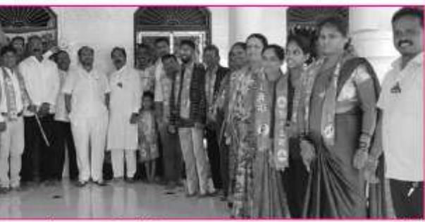
खेड-चाकाळे येथील उषाठा गटातून शिंदे गटात प्रवेश केलेल्या कार्यकर्त्यांचे स्वागत करताना शिवसेनेचे नेते रामदास कदम सोबत अन्य पदाधिकारी.