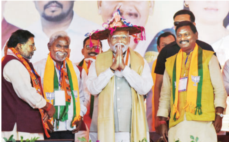
Prime Minister Narendra Modi during Vijay Sankalp Sabha ahead of the Jharkhand Assembly elections, in Chaibasa, West Singhbhum district, on Monday

In Chaibasa, Modi said the BJP picked its tribal leaders to be the chief ministers of neighbouring Odisha and Chhattisgarh. He said several governors were tribals. At the Centre, key ministerial portfolios were with the BJP's tribal leaders, including Jai Oram, Durgadas Uikay, Savitri Thakur and Sarbananda Sonowal, the PM said, adding