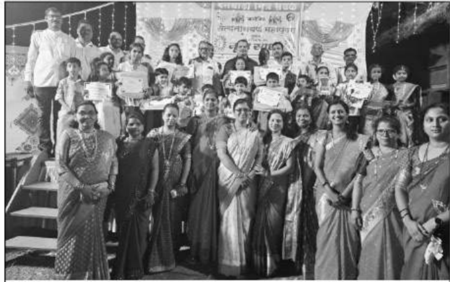
खेडी दत्तवाडी येथे श्री सत्यनारायण महापूजा संपन्न झाली. यावेळी वक्षिण वितरण करण्यात आले त्यावेळचे छायाचित्र.