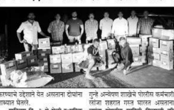
गोवा बनावटीची विदेशी मद्याची विक्री करणारे दोघे ताब्यात. शनिवार दि. ३ मे रोजी स्थानिक गुन्हे अन्वेषण शाखेने ही कारवाई केली. त्यांना शहरात गस्त घालत असताना त्यांना गोपनीय माहिती मिळाली की