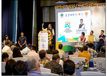
જણાવ્યું હતું કે આ રેમ્પિયનશિપ ભારત માટે વૈશ્વિક સ્પોર્ટિંગ પ્લેટફોર્મ તરીકે સોફ્ટ પાવર પ્રદર્શિત કરવાની એક મોટી તક રજૂ કરે છે. મંત્રીશ્રીએ વધુમાં ઉમેર્યું હતું કે ઉરેશને હવે યોગાસનને આંતરરાષ્ટ્રીય રમત તરીકે માન્યતા આપવાના માટે ઈન્ડરનેશનલ ઓલિમ્પિક કમિટિયના માળખા સાથે સહકારી મંડળીઓને મેળવવા સરકાર કામ કરતું જોઈશે.

"ભારતના પ્રાચીન જ્ઞાપ્તિ લઈને વૈશ્વિક સ્પોર્ટિંગ પ્લેટફોર્મ સુધી, યોગ વિશ્વની સહાયકારી શક્તિ બની રહ્યો છે"; કેન્દ્રીય યુવા ભાષ્ટને અને રમતગમત મંત્રી મનસુખ માંડવિયા "૨૦૩૬ની ઓલિમ્પિક માટે ભારતની દાવેદારીની સાથે, યોગાસનને ઓલિમ્પિક રમત તરીકે સ્થાપિત કરવાના પ્રયાસો ચાલી રહ્યા છે"; કેન્દ્રીય મંત્રી ડૉ. મનસુખ માંડવિયા "યોગ ભારતની સોફ્ટ પાવર અને સ્વાસ્થ્ય, આર્થિક તક તેમજ વૈશ્વિક માન્યતાનું માધ્યમ બની ચયો છે"; ડૉ. માંડવિયા