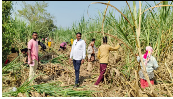
આ નિર્ણયથી સહકારી ખાંડ મંડળીઓ પરનો રૂ. ૧,૫૦૦ કરોડનો મોટો ફાયદો બે લાખથી વધુ શેરી ઉત્પાદક ખેડૂતો અને ખાંડ મંડળીઓને મળશે તેની રાહત

ગાંધીનગર એસ.ઓ. મુખ્યમંત્રી શ્રી ભૂપેન્દ્રભાઈ પટેલના નેતૃત્વમાં રાજ્ય સરકારે સહકારી જેટલો અને પાકા કરીને શેરી પકવતા ખેડૂતોના હિતમાં મહત્વપૂર્ણ નિર્ણય કર્યો છે. આ નિર્ણયની વિગતો આખતો કૃષિ અને સહકાર મંત્રી શ્રી જીતુભાઈ વાઘાણીએ જણાવ્યું હતું કે, વર્ષ ૨૦૦૭-૦૮ થી ૨૦૧૪-૧૫ દરમિયાન ખાંડ મંડળીઓએ શેરી પકવતા ખેડૂતોને ચૂકવેલા શેરીના ભાવોને રાજ્ય સરકારે સત્તાવાર મંજૂરી આપી છે. રાજ્ય સરકારના આ નિર્ણયથી અંતર્રાષ્ટ્રીય ખાંડ સહકારી મંડળીઓને જુદાઈ પાડી ૧,૫૦૦ કરોડનો મોટો આર્થિક ફાયદો થશે, જેનો સીધો લાભ બે લાખથી વધુ ખેડૂતોને થશે.