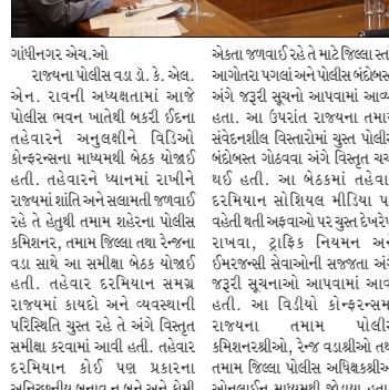
ગાંધીનગર એસ.ઓ. રાજ્યના પોલીસ વડા ડૉ. કે. એલ. એન. રાવની અધ્યક્ષતામાં બકરીઉદ્ધ તહેવારને અનુલક્ષીને વિડિઓ કોન્ફરન્સના માધ્યમથી સમીક્ષા બેઠક યોજાઈ હતી. તહેવારને ધ્યાનમાં રાખીને રાજ્યમાં શાંતિ અને સલામતી જાળવવા તે તે હેતુથી તમામ શહેરોના પોલીસ કમિશનર, તમામ જિલ્લા તથા રેન્જના વડા સાથે આ સમીક્ષા બેઠક યોજાઈ હતી. તહેવાર દરમિયાન સમગ્ર રાજ્યમાં કાયદો અને વ્યવસ્થાની પરિસ્થિતિ યુક્ત રહે તે અંગે વિસ્તૃત સમીક્ષા કરવામાં આવી હતી. તહેવાર દરમિયાન કોઈ પણ પ્રકારના અવ્યવસ્થિતતા ઘટના બને અને કોઈ

તહેવાર દરમિયાન સોશિયલ મીડિયા પર વહેતી ઘટી અફવાઓ પર યુક્ત ઉદ્ધેશન રાખવા સૂચના