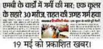
19 मई को प्रकाशित खबर।

इन व्यापारियों ने निभाई सामाजिक जिम्मेदारी इस पहल में राजमंदिर इलेक्ट्रॉनिक्स, नाकोड़ा इंटरप्राइजेस, एमएस एंड कंपनी, जेनम इलेक्ट्रो प्लाजा, अजमेर डीजल, आलोक टॉक, दिशा इंटरप्राइज, श्रीटेक सॉल्यूशंस, शिवम इलेक्ट्रॉनिक्स, मोनिका इलेक्ट्रॉनिक्स, अनंत इंटरप्राइज, श्री सिद्धम इंटरप्राइजेस, संजरी इलेक्ट्रॉनिक्स, गणेश नेक्स्ट जोधपुर, हितार्थ सेल्यु, ओम इलेक्ट्रॉनिक्स सेल एंड सर्विस, लिबर्टी मार्केटिंग, लिबर्टी एजेंसियां, जय जिन्ट्र इलेक्ट्रॉनिक्स, अग्रवाल इंटरप्राइजेस शोभापुरा और सागर इलेक्ट्रॉनिक्स ने सहभागिता निभाई।