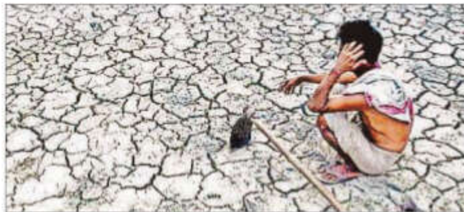
A developing El Niño is threatening to curb rainfall and push up food prices just as an easing oil relieves broader price pressures

Reserve Bank of India officials have said they are closely monitoring the weather to