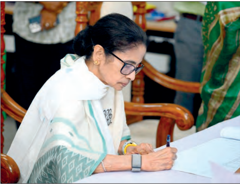
মনোনয়নপত্রে সই করছেন ভবানীপুর কেন্দ্রের প্রার্থী মুখ্যমন্ত্রী মমতা বানার্জি। মাঝে, শ্রীরামপুরের মুখ্যমন্ত্রীর জনসভায় মহিলাদের চল। ডান দিকে, বলাগড়ে আদিবাসী শিল্পীদের সঙ্গে মুখ্যমন্ত্রী। রয়েছেন সাংসদ রচনা বানার্জি। বুধবার।