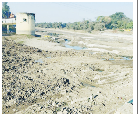
पालिका की संयुक्त टीम बनाई और नदी किनारे मोटरों से पानी खींच रहे 22 मोटर जप्त की। हर बार यही होता है -जब नगर पालिका जल संसाधन विभाग से राशि जमा कर पार्वती नदी में पानी छोड़ती है तब यही होता है नदी किनारे दोनों ओर किसान मोटर लगाकर पानी खींचते हैं इसमें सबसे बड़ी लापरवाही नगर पालिका की होती है नगर पालिका कई दिनों तक ध्यान नहीं देती अगर यही करवाई एक हफ्ते पहले होती तो पार्वती नदी में समय पर पानी आ जाता और शहरवासियों को जल संकट का सामना भी नहीं करना पड़ता।

आष्टा। नगर की जीवनदायिनी पार्वती नदी से मोटर डाल कर पानी चोरी करने पर नगर पालिका की टीम ने 22 मोटर जप्त की हैं नगर पालिका ने जल संसाधन विभाग से 3 लाख की राशि जमा कर रामपुरा डैम से 4 फरवरी को पानी छुड़ाया था लेकिन 10 दिन बाद भी शहर पानी नहीं आ सका अभी भी 2 दिन के लगभग समय लगेगा। दरअसल नगर का एकमात्र पेयजल स्रोत पार्वती नदी ही है नगरवासियों को पूरे साल पीने व घरेलू उपयोग के लिए यह पानी नगर पालिका द्वारा नालों के माध्यम से सप्लाई किया जाता है। किसान कर रहे थे पानी चोरी -नदी के आसपास के खेतों के किसान अवैध रूप से मोटर लगाकर फसलों की सिंचाई के लिए पानी की चोरी कर रहे थे, बारिश के बाद से लगातार अभी तक पाइपलाइन डालकर मोटर से पानी खींचा जा रहा था 15 से 20 किलोमीटर के परियोजना में नदी के दोनों ओर कई किसान मोटरों से पानी खींच रहे थे जब 10 दिन में रामपुरा डैम से अपनी आष्टा नहीं पहुंचा तो नगर पालिका के अधिकारी जागे और पुलिस और नगर