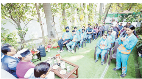
करते हुए कुल 82 पदकों के साथ राज्य की सूची में तृतीय स्थान प्राप्त किया है। उन्होंने सभी विजेता खिलाड़ियों को बधाई देते हुए उनके उज्वल भविष्य की कामना की। इस अवसर पर मध्यप्रदेश