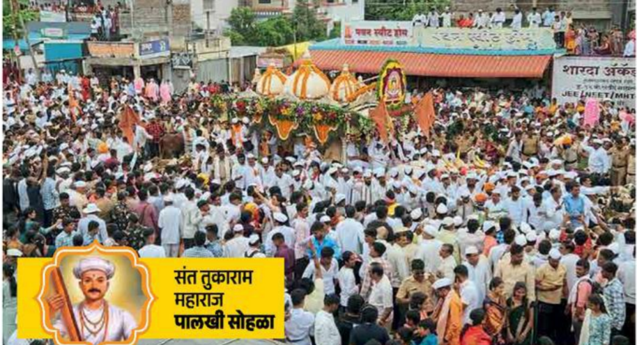
काटेवाडी, ता. बरामती : संत तुकाराम महाराज पाळखी सोहळ्यात रंगले मेंढ्यांचे रिंगण आणि उपस्थित वारकरी भाक्त.

राजेंद्रकृष्ण कापसे : सकाळ वृत्तसेवा सणसर, ता. २७ : जगदगुरू संत तुकाराम महाराजांचा पाळखी सोहळा शुक्रवारी भक्तिरसात न्हालेला पाहायला मिळाला. काटेवाडीत परीट समाजाने पायघड्यांनी स्वागत केले, इंद्रापुर तारुक्यातील सणसर येथे सोहळा मुक्कामी विसावला. गातो नाचतो आनंदे। टाळघागरिया छंदे ॥ तुझी तुज पुढे देवा। नेणां भावे केसी सेवा ॥