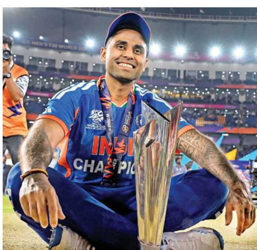
अहमदाबाद के नरेन्द्र मोदी स्टेडियम में रविवार को टी-20 विश्व कप का खिताब अपने नाम करने के बाद भारतीय टीम के कप्तान सूर्यकुमार ने ट्राफी के साथ पिच पर बैटकर तस्वीर खिंचवाई।

इन्फ्रास्ट्रक्चर का प्रतीक, भरोसे की विरासत