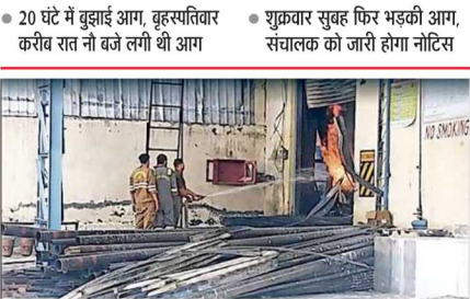
मेरठ रोड पर पेंट गोदाम में लगी आग बुझाते अग्निशमनकर्मी