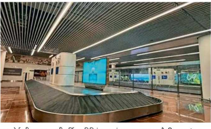
एयरपोर्ट की शानदार यात्री टर्मिनल बिल्डिंग का अंदर का नजारा • चौ. विद्याल प्रबंधन