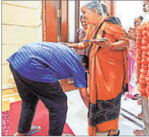
आपने आवास पर पहुँचकर माँ से आशीर्वाद लेते केजरीवाल।

केजरीवाल ने कहा कि मैं भगवान से प्रार्थना करता हूँ कि जैसे आज तक ऊपर वाले ने मुझे रास्ता दिखाया और ताकत दी, उसी तरह मुझे आगे भी रास्ता दिखाते रहें, ताकि मैं