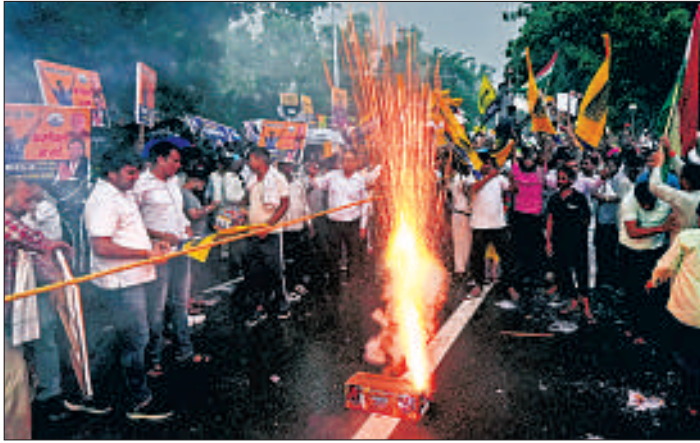
नई दिल्ली में शुक्रवार को केजरीवाल की जमानत पर समर्थकों ने पटाखे जलाकर जश्न मनाया।