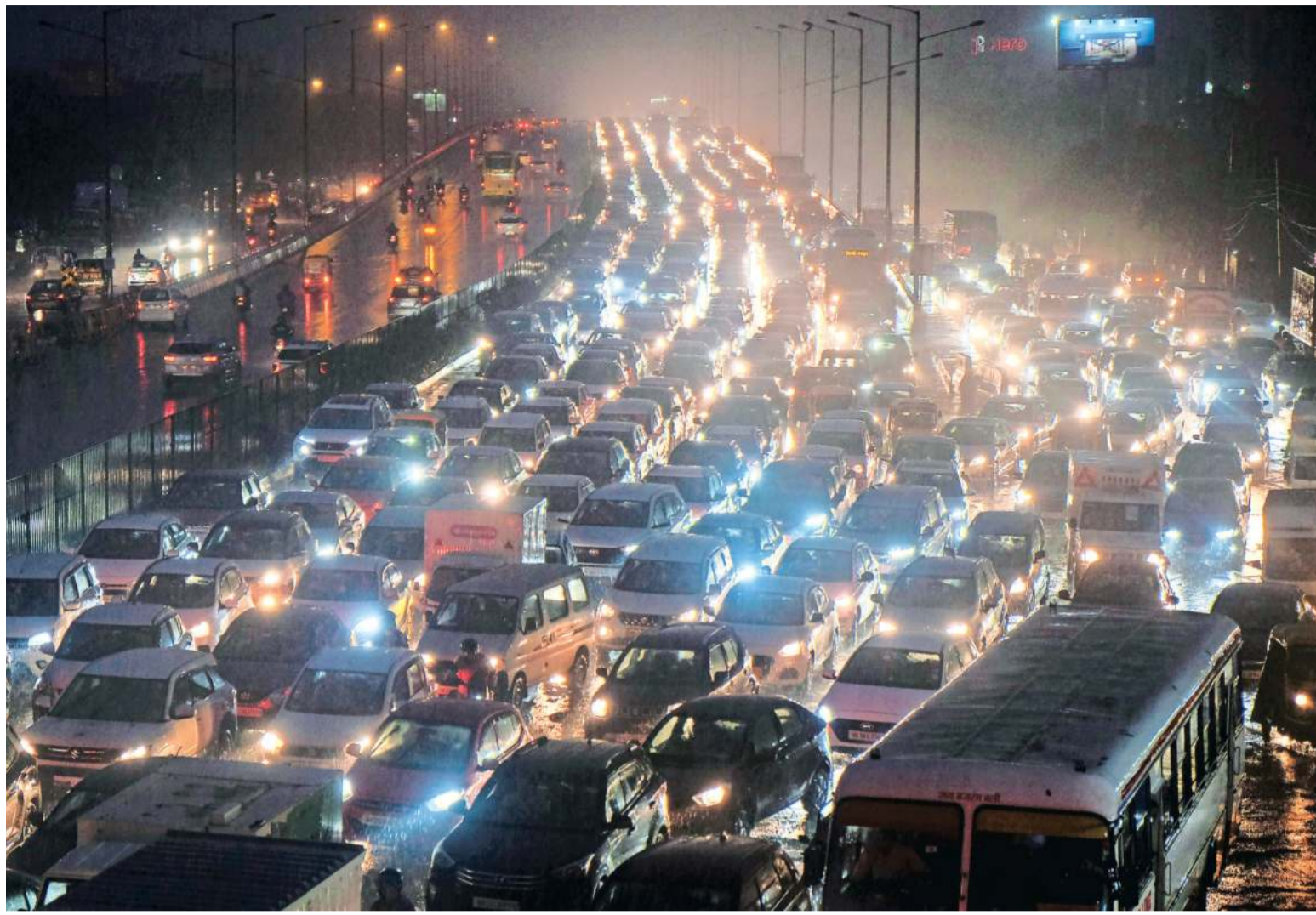
Vehicles stuck in a traffic jam on Delhi-Gurgaon Expressway during heavy rain in Gurugram on Friday. PTI