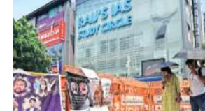
Three UPSC aspirants drowned at centre in July. File

Additionally, the court suggested the Lieutenant Governor (L-G) appoint a committee chaired by a former judge to ensure that coaching centres do not operate by violating norms and