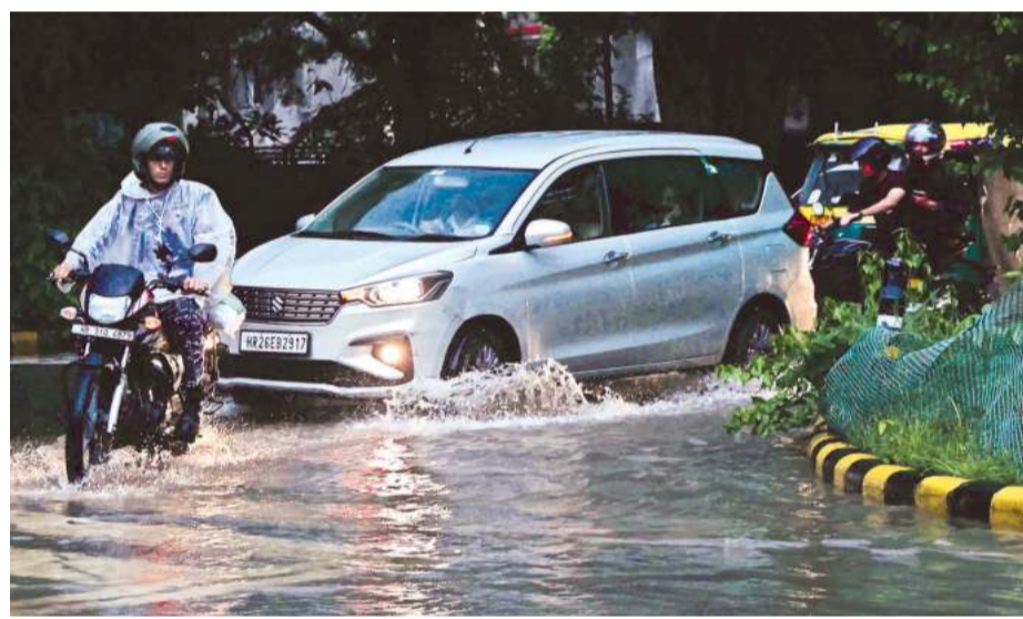
A waterlogged street in Delhi. Amit Mehra

A traffic advisory was also issued due to waterlogging at