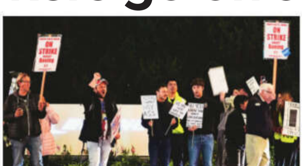
Boeing workers picket after union members voted to reject a contract offer and go on strike on Friday outside the company's factory in Renton, Washington

Boeing plays a substantial role in the US economy. It employs almost 150,000 peo-