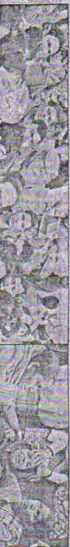
नई दिल्ली: 1 दशमिया इलाके में एक महिला ने की खुदकुशी

संक्षिप्त खबरें महिला ने की खुदकुशी नई दिल्ली: 1 दशमिया इलाके में एक