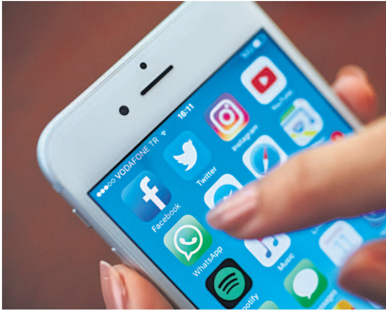
While companies benefit from employee-generated content, or EGC, they need to have at least some control over the content posted on their websites.

EGC is a recent concept in India after its success in the West, Piyush Agrawal, co-founder of influencer management