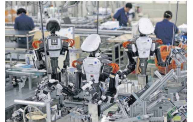
Deeptech funds put in between $250,000 and $1.5 million when they enter startups at the pre-seed and seed stage.

Elevation Capital has made one investment this year, a $10 million Series A with aerospace component maker Jeh Aerospace. However, the fund has said that they now have more