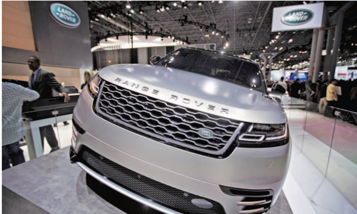
Tata Motors-owned firm more than doubled its separation bill to ₹742 cr as part of its workforce reduction efforts.