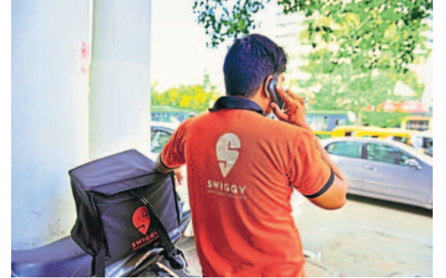
Restaurants say Toing does not offer self-service dashboard to manage pricing, forcing them to rely on Swiggy staff for changes.