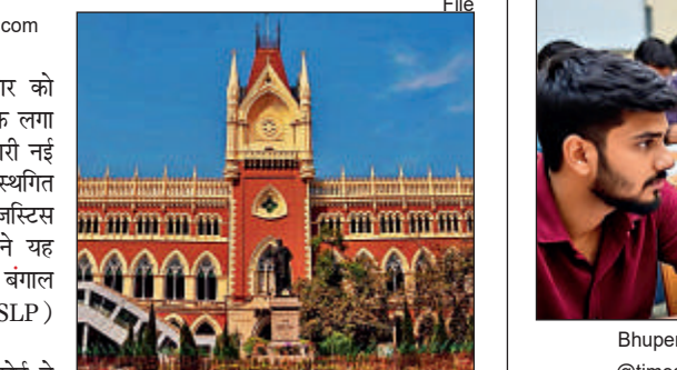
चौफ जस्टिस ने हेरानी जताई कि हाईकोर्ट ने यह कहा कि केवल विधायिका को ही ओबीसी सूची को मंजूरी देने का अधिकार है। सुप्रीम कोर्ट में पश्चिम बंगाल सरकार की ओर से पेश हुए सीनियर वकील कपिल सिब्बल ने अदालत से आग्रह किया कि हाई कोर्ट के आदेश पर रोक लागू जाए, क्योंकि इससे कई नियुक्तियों और प्रमोशन ठप हो जाएं।

■ नई दिल्ली: सुप्रीम कोर्ट ने सोमवार को कलकत्ता हाईकोर्ट के उस आदेश पर रोक लगा दी, जिसमें पश्चिम बंगाल सरकार की जारी नई अन्य पिछड़ा वर्ग (OBC) सूची को स्थगित कर दिया गया था। सुप्रीम कोर्ट के चीफ जस्टिस बी.आर. गवई की अगुआई वाली बेंच ने यह अंतरिम आदेश पारित करते हुए पश्चिम बंगाल राज्य द्वारा दायर विशेष अनुमति याचिका (SLP) पर नोटिस जारी किया।