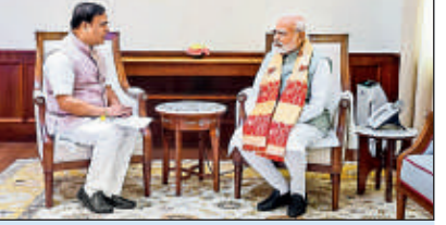
असम के मुख्यमंत्री हिमंता बिस्वा सरमा सोमवार को प्रधानमंत्री नरेन्द्र मोदी से मिले, कल्याणकारी योजनाओं में हुई प्रगति की जानकारी दी।