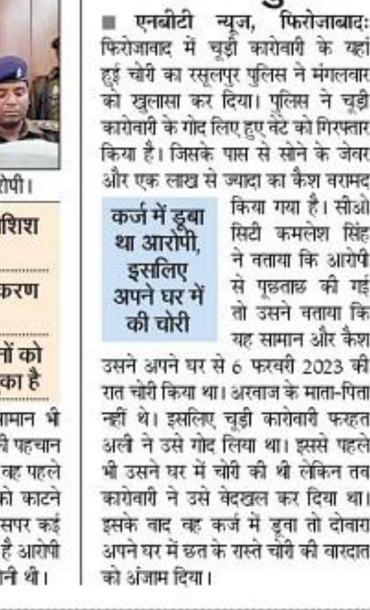
पुलिस की गिरफ्तार में आरोपी।