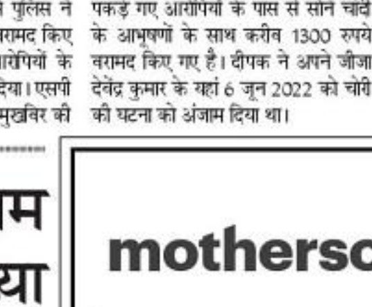
पुलिस की गिरफ्तार में दोनों आरोपी।

जिले की पुलिस ने जीजा के घर चोरी करने वाले साले और उसके एक दोस्त को गिरफ्तार किया है। पकड़े गए आरोपियों के पास से पुलिस ने चोरी किए गए गहने और कैश बरामद किए हैं। गंगलवार को पुलिस ने आरोपियों के खिलाफ कार्रवाई कर जेल भेज दिया। एनबीटी न्यूज की गिरफ्तार में दोनों आरोपी।