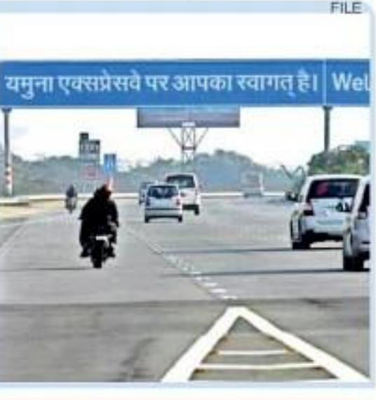
यमुना एक्सप्रेसवे पर आपका स्वागत है।

■ शव शत-विशत होने के चलते मुक्त की पहचान नहीं हो सकी है ■ पुलिस ने गाड़ी में सवार सभी को हिरासत में लेकर पृथक्करण शुरू की ■ मूलक के पास से एक मोबाइल और 500 रुपये बरामद हुए हैं