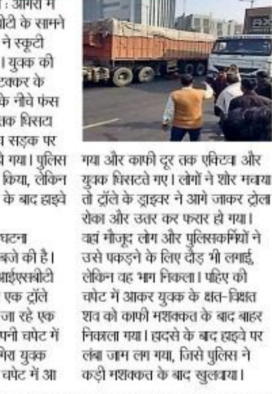
गाड़ी और कारों दूर तक खिंचा और युवक हिरासत में ले लिए।

■ एनबीटी न्यूज, आगरा : आगरा में दिल्ली हाइवे पर आज्ञासिद्धी के समान गंगलवार सुबह एक ट्रॉले ने स्कूटी सवार युवक को रौंदा दिया। युवक की मौके पर ही मौत हो गई। ट्रॉकर के बाद युवक ट्रॉले के पहिए के नीचे फंसा गया और उसी काफ़ी दूर तक धिस्तार गया। ट्रॉले का ड्राइवर बीच सड़क पर ही बाह्य छोड़कर फरार हो गया। पुलिस ने उसी फकड़ने का प्रयास किया, लेकिन वे हाथ नहीं आया। सदरसे के बाद हाइवे पर जाय लम गया।