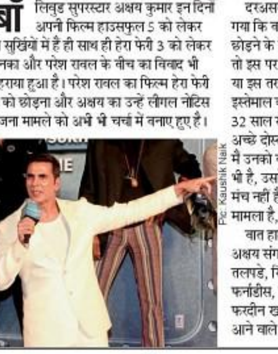
लिखित सुपरस्टार अक्षय कुमार इन दिनों अपनी फिल्म हाउसफुल 5 को लेकर जो सुर्खियों में हैं ही साथ ही हेग फेरी 3 को लेकर उनका और पेशा रावल के बीच का विवाद भी चर्चा का विषय है। पेशा रावल का फिल्म हेग फेरी 3 को छोड़ना और अक्षय का उन्हें लीगल नॉटिस भेजना मामले को अभी भी चर्चा में बनाए हुए है।

लेकिन अब अक्षय ने इस मामले में अपनी चुप्पी तोड़ी है। दरअसल, एक इन्वेट के दौरान जब उनसे पूछा गया कि बहुत से लोग पेशा रावल के हेग फेरी 3 छोड़ने के फैसले को मुश्किलपूर्ण करण दे रहे हैं, तो इस पर अक्षय ने कहा, 'सबसे पहले तो मुझे या इस तरह के शब्द उनके (पेशा रावल) लिए इस्तेमाल करना सही नहीं है। मैं उनके साथ करीब 32 साल से काम करता आया हूँ। हम दोनों बहुत अच्छे दोस्त रहे हैं। वह कमाल के अभिनेत्री हैं। मैं उनको बहुत पसंद करता हूँ। लेकिन जो कुछ भी है, उसके बारे में बात करने के लिए यह सही मंच नहीं है। जो होना था वो हुआ, यह बहुत गंभीर मामला है, जिस पर कोर्ट में बात होगी।'