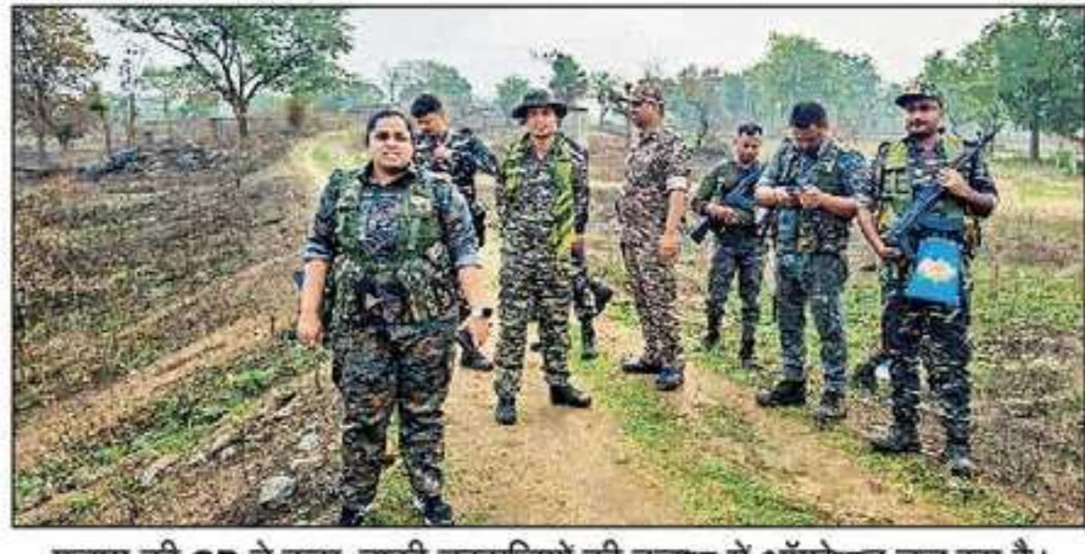
पलामू की SP ने कहा, बाकी नक्सलियों की तलाश में ऑपरेशन चल रहा है।

झारखंड के पलामू जिले में सुरक्षाबलों और नक्सलियों के बीच हुई मुठभेड़ में प्रतिबंधित संगठन CPI (माओवादी) का एक कमांडर मारा गया है। पुलिस के एक सैन्य अधिकारी ने मंगलवार को बताया कि मुठभेड़ में एक और नक्सली घायल हुआ है, जिस पर 15 लाख रुपये का इनाम था। पुलिस ने बताया कि मुठभेड़ के बाद तलाशी अभियान के दौरान एक सेल्फ-लॉडिंग राइफल (SLR) समेत कई हथियार बरामद किए गए हैं। यह मुठभेड़ सोमवार को हुसैनाबाद थाना क्षेत्र के बरवाही और नईया गांव के बीच हुई।