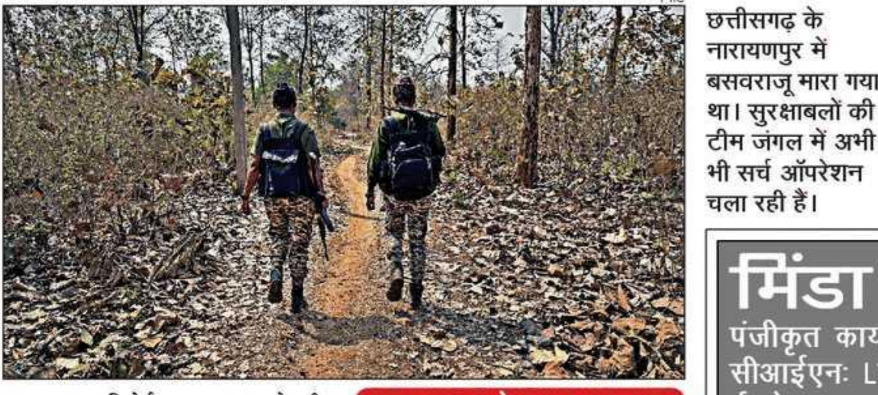
छत्तीसगढ़ के नारायणपुर में बसवराजू मारा गया था। सुरक्षाबलों की टीम जंगल में अभी भी सर्च ऑपरेशन चला रही है।