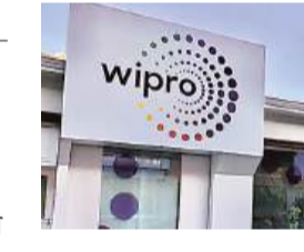
नफा मिळविला होता. तर सरलेल्या मार्च तिमाहीत कंपनीचा महसूल ७.६ टक्क्यांनी वधारून २४,२३६.३ कोटी रुपये झाला आहे. तर संपूर्ण आर्थिक वर्षात कंपनीने ९३,९९७.७ कोटी रुपयांचा नफा मिळविला आहे. आर्थिक वर्ष २०२६ मधील कंपनीचा एकूण महसूल ३.९६ टक्क्यांनी वाढून ९२,६२४ कोटी रुपयांवर पोहोचला.

माहिती-तंत्रज्ञान क्षेत्रातील अग्रणी विप्री लिमिटेडच्या संचालक मंडळाने समभाग पुनखरेदी (बायबॅक) योजनेची गुरुवारी घोषणा केली. यासाठी कंपनी १५,००० कोटी रुपये खर्च करणार आहे. गुरुवारच्या सत्रातील समभागाच्या बाजार भावाच्या तुलनेत १९ टक्के अधिमूल्य देऊ करत प्रत्येकी २५० रुपयांना कंपनीने ते भागधारकांकडून खरेदी करणार आहे. कंपनीकडून राबवली जाणारी ही सहावी ‘बायबॅक’ योजना आहे. यापूर्वी वर्ष २०२३ मध्ये १२,००० कोटी रुपये, २०२१ मध्ये ९,५०० कोटी रुपये, २०१९ मध्ये १०,५०० कोटी रुपये, २०१७ सालात ११,००० कोटींची आणि त्या आधी १६ सालात २,५०० कोटी रुपये कंपनीने योजनेखाल खर्च करून भागधारकांच्या पदरी भरभरून फायदा दिला आहे. विप्रीच्या संचालक मंडळ बैठकीने मंजुरी दिलेल्या योजनेनुसार, कंपनीकडून