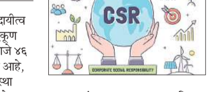
व्यवहार मंत्रालयाचा अहवाल आणि सहा कन्सल्टिंगचा अहवालही सांगतो. महाराष्ट्रासह, गुजरात, कर्नाटक, तामिळनाडू या चार राज्यांमध्ये एकूण राष्ट्रीय सीएसआर खर्चाचा तब्बल ७० टक्के हिस्सा खर्च होतो. उल्लेखनीय म्हणजे ही चारही औद्योगिकदृष्ट्या पुढारलेली आहेत आणि कंपन्या ते कार्यरत असलेल्या भौगोलिक क्षेत्रांतच खर्च करून, या संबंधाने ‘आपलं आणि परकं’ असाच व्यावहारिक दृष्टिकोन अनुभवाताना दिसतात, असे मत सत्वचा अहवाल व्यक्त करतो.

मुंबई : कंपन्यांच्या ‘सामाजिक दायित्व उपक्रमां’वरील (सीएसआर) एकूण खर्चापैकी जवळपास निम्ना म्हणजे ४६ टक्के वाटा एकट्या महाराष्ट्राचा आहे, असे आघाडीची परामार्गाने संस्था असलेल्या ‘क्रिसिल’ने तयार केलेला ताजा अहवाल दर्शवतो. अहवालानुसार, भारतीय उद्योग जगताचा एकूण ‘सीएसआर’वरील खर्च आर्थिक वर्ष २०२३ मधील १४,७१४ कोटी रुपयांवरून, आर्थिक वर्ष २०२४ मध्ये ३० टक्क्यांनी वाढला. देशभरात झालेल्या या एकूण १९,२०८ कोटी रुपयांच्या खर्चापैकी ४६.५३ टक्क्यांहून अधिक खर्च एकट्या महाराष्ट्रात केला गेला. आर्थिक वर्ष २०२४ मध्ये राज्यात एकूण ८,९३९ कोटी रुपये ‘सीएसआर’ उपक्रमांवर खर्च झाले. त्या आधीच्या २०२३ मध्ये देशपातळीवर खर्चात महाराष्ट्राचा वाटा ४५.१९ टक्क्यांवर होता, असे क्रिसिलने म्हटले आहे. महाराष्ट्र हे सातत्याने उद्योगांकडून होणाऱ्या लोकोपयोगी घडामोडीबाबत अग्रेसर राज्य राहिले आहे. २०१४ पासून कायदा लागू होऊन कंपन्यांना असा खर्च बंधनकारक केले जाण्याआधीपासून ही परंपरा आहे. परंतु, मत दशकाभरात महाराष्ट्रच अशा निधींचा सर्वाधिक वाटेकरी ठरत असल्याचे केंद्रीय कंपनी