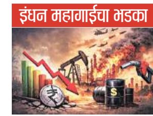
टक्क्यांच्या नकारात्मक पातळीवरून (डिप्लेशन), आता वेगाने वाढून ६.२४ टक्क्यांवर पोहोचली आहे. मात्र खाद्यान्न

मासिक आधारावर पाहता, मार्च २०२६ मध्ये घाऊक महागाई वेगाने वाढून ३.८८ टक्क्यांवर पोहोचली; मागील महिन्यातील २.९३ टक्के आणि गेल्या वर्षीच्या याच महिन्यातील २.२५ टक्क्यांच्या तुलनेत ही लक्षणीय वाढ आहे. महागाईतील ही वाढ प्रामुख्याने इंधनाच्या किमतींमध्ये झालेल्या तीव्र वाढीमुळे आहे. इंधन महागाई मागील महिन्यातील (उणे) ३.६४