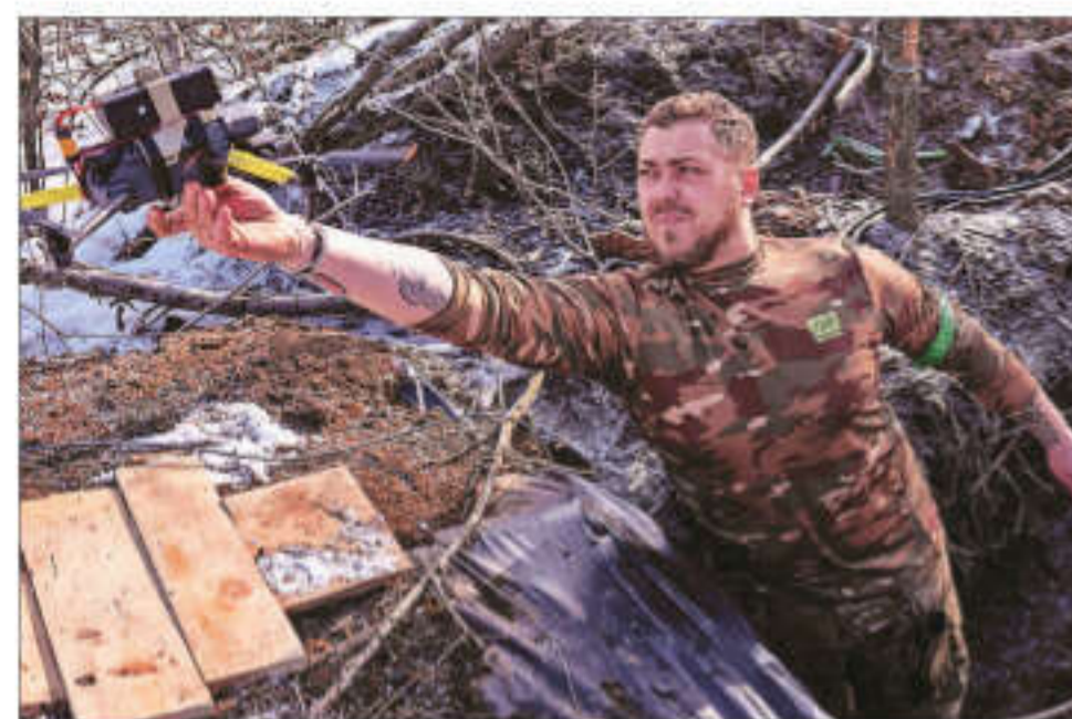
A Ukrainian soldier launches a drone from a shelter in partially occupied Toretsk, the site of heavy battles with the Russian troops in the Donetsk region, Ukraine, on Saturday

Zelenskyy said that in total, nearly 1,150 attack drones, more