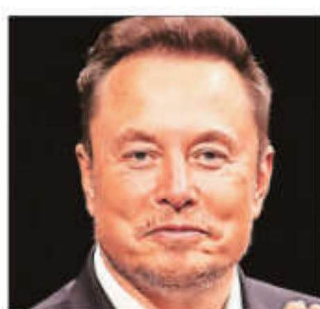
Elon Musk's mounting pressure on the federal work force came at the encouragement of Trump