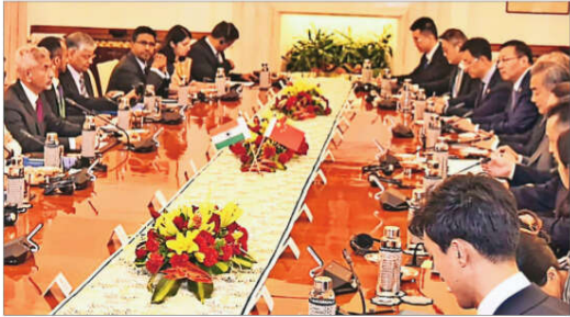
External affairs minister S Jaishankar with Chinese foreign minister Wang Yi, in New Delhi on Monday

Jaishankar held wide-ranging talks with the Chinese foreign minister shortly after he landed in Delhi on a two-day visit that came days ahead of