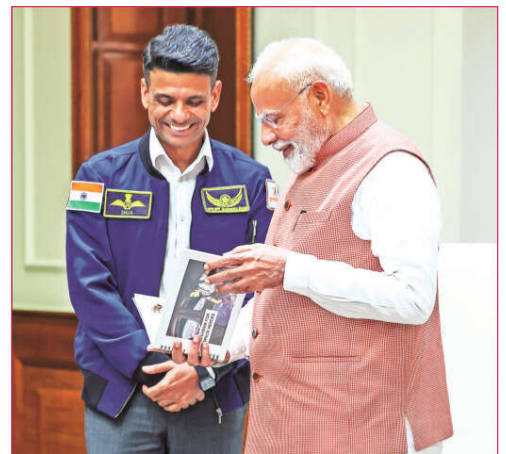
Prime Minister Narendra Modi with astronaut Shubhanshu Shukla at his residence on Monday. Shukla gifted the Prime Minister the mission patch of the Axiom-4 mission and the Indian tricolour that he had taken with him to the International Space station