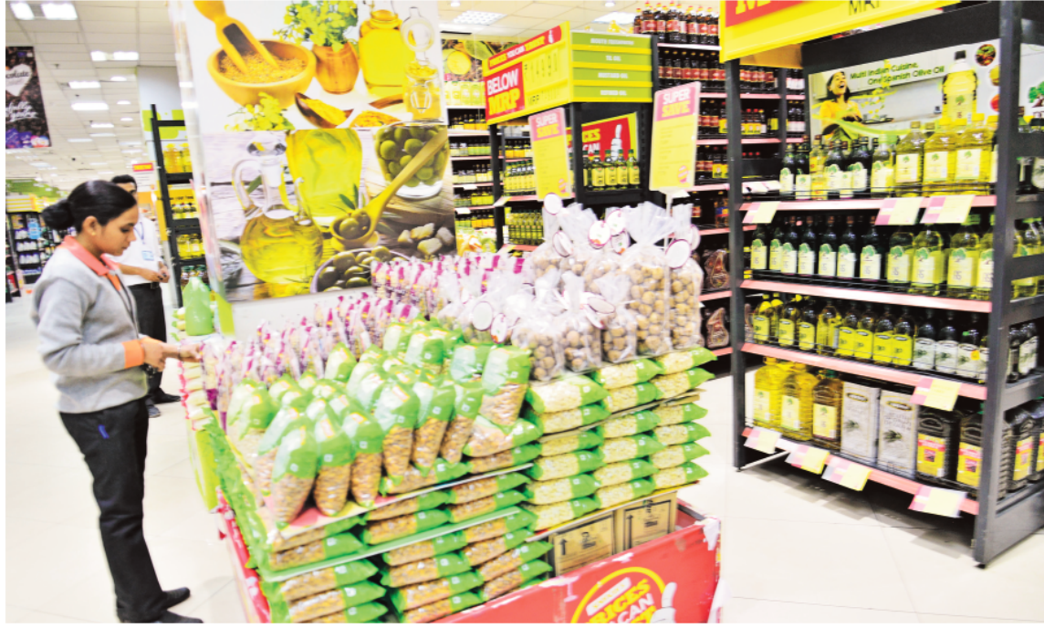
India's retail inflation dropped to a multi-year low of 2.10% in June 2025 due to easing food prices.

"During the quarter (April-June), we witnessed stable to improving demand trends in India across urban and rural. Premium categories continue to outperform the mass segment while alternate channels like modern trade e-commerce and especially quick commerce continue to lead growth.... Looking ahead, we are optimistic about a gradual and broad-based recovery in consumption sentiment supported by easing retail and food inflation, a favorable monsoon, increased government spending and higher MSP (minimum