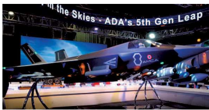
Full-scale model of the Advanced Medium Combat Aircraft, which was showcased at the 15th edition of Aero India in Bengaluru in February this year

Pune-headquartered Bharat Forge is a private sector defence player, having secured both domestic and export orders for heavy artillery systems, with a footprint in armoured vehicles and, more recently, small jet engines. Bengaluru-headquartered BEML is a 'Schedule A' company under the Ministry of Defence (MoD), operating across the defence, railways, mining, and construction sectors. Chennai-headquartered Data Patterns, another private sector company, provides indigenous solutions in the areas of radars, electronic warfare, avionics, glass cockpit