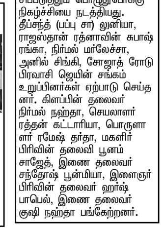
மெட்ராஸ் ரயல் கிளப், சென்னையில் ஆதரவு மன்றம், முதியோர், மாற்றுத்திறனாளிகளை இல்லங்களை சேர்ந்த 700-க்கும் மேற்பட்டவர்களை மகிழ்ச்சிப்படுத்தும் பொருட்களுக்கு நிகழ்ச்சியை நடத்தியது.