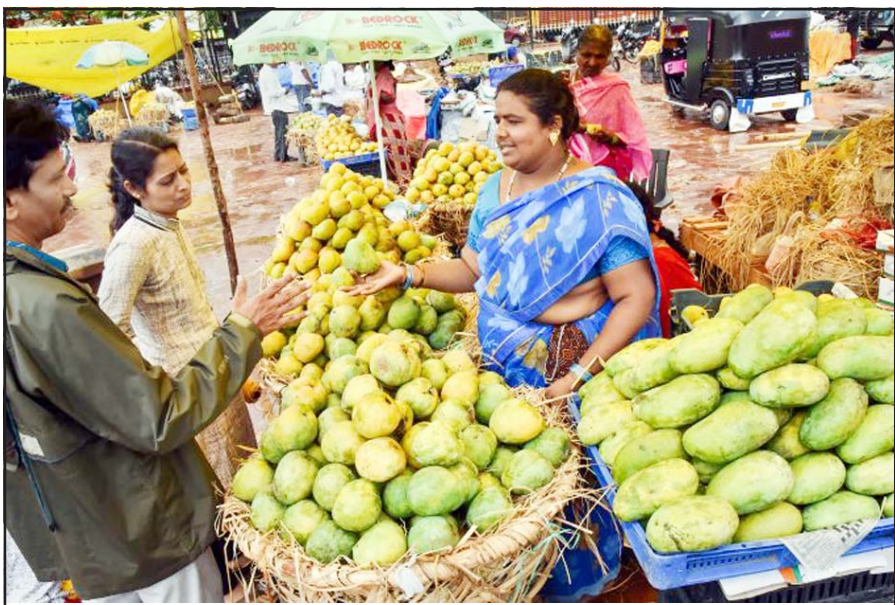
દેશમાં આ વરસે વિષમ હવામાનના કારણે કેરીનો પાક ઉપર માઠી અસર પડી છે, આંબા પર આવેલો મોર ભીષણ ગરમીના કારણે ખરી જવાથી તેમજ કમોસમી વરસાદના કારણે કેરીનું ઉત્પાદન ઓછું થતાં તેમજ બજારમાં પાક મોડો આવતા ભાવ આસમાને ગયેલા છે, કણાટકના હુબલી શહેરના મોર્કેટ ખાતે એક મહિલા વેન્ડર તોતાપુરી કેરી વેચી રહી છે.

નવી દિલ્હી, તા. ૧૯ દેશમાં કોરોનાના નવા કેસમાં સતત વધઘટ થઈ રહી છે. ગુરુવારે ૨૩૬૪ નવા સંક્રમિત મળી આવ્યા હતા, જ્યારે બુધવારે ૧૮૨૯ નવા કેસ મળી આવ્યા હતા. મંગળવારે ૧૫૬૯ નવા કેસ નોંધાયા હતા ગુરુવારે સવારે ૮ વાગ્યે કેન્દ્રીય સ્વાસ્થ્ય મંત્રાલય દ્વારા અપડેટ કરવામાં આવેલા ડેટા અનુસાર, છેલ્લા બે દિવસથી નવા સંક્રમિતોની સંખ્યામાં વધારો થઈ રહ્યો છે. જોકે, સાજા થનારા લોકોની સંખ્યા નવા સંક્રમિત લોકો કરતા વધુ છે. છેલ્લા ૨૪ કલાકમાં ૨૫૮૨ લોકોએ કોરોનાને હરાવ્યો અને તેની સામે ૧૦ લોકોએ જીવ ગુમાવ્યા. દેશમાં સક્રિય કેસોમાં ૨૨૮૦નો ઘટાડો થયો છે અને તેમની સંખ્યા ૧૫,૪૧૯ છે.