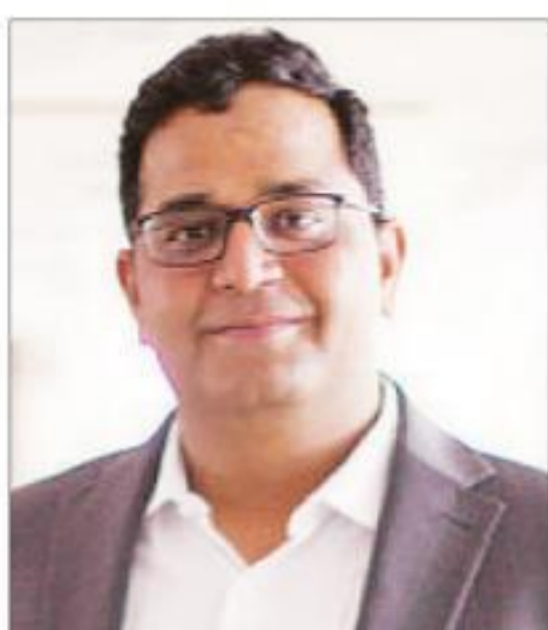
Paytm CEO Vijay Shekhar Sharma

Describing his approach as a rewind-and-reset, Sharma is on a mission to win back investors. And he'll have his hands full: Paytm's operating losses widened over the past year to about $350 million, competition is intensifying and investors have lam-