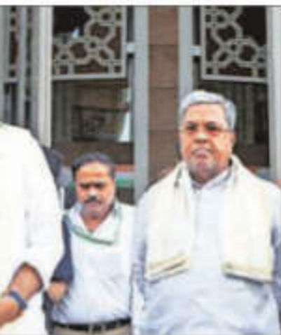
M Siddaramaiah (right) and DK Shivakumar leave after party meeting at Indira New Delhi on Tuesday

Siddaramaiah would continue as minister and that there would be no change in leadership. In a meeting, AICC general secretary (organisation) KC Venugopal, Siddaramaiah and Shivakumar discussed the entire discussion was centered on the coming Rajya Sabha and Council elections in Karnataka. "Whatever speculation you hear... that is only speculation at all. Today, we discuss Rajya Sabha seats and Council elections in Karnataka".