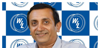
உற்பத்தி செய்வதற்காக ஒரு கூட்டு முயற்சி முன்மொழியப்பட்டுள்ளது. இத்தயாரிப்புகள் உலகளவில்

சென்னை, மே 21 டிஎஸ்எஃப் குழுமம் (வீல்ஸ் இந்தியா லிமிடெட் மற்றும் பிரேக்குஸ் இந்தியா பிரைவேட் லிமிடெட்) மற்றும் போஷ் ஆய்வற்றக்கு இடையே, வர்த்தக வாகனங்களுக்கான (வாரிகள் மற்றும் பெருந்துகள்) அடுத்த தலைமுறை மின்னணு முறையில் கூட்டுப்படுத்தப்படும் காற்று (ஏர்) அமைப்புத் தயாரிப்புகளை உருவாக்கி