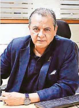
Considered an authoritative voice in the Indian political reporting scene