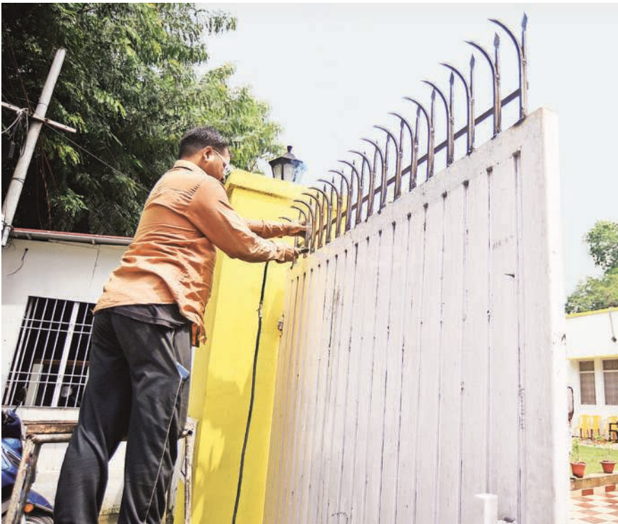
The gates of UP minister OP Rajbhar's Lucknow residence being fortified on Monday. Rajbhar is being targeted by ABVP for his 'goonda' remark on student protesters.

The ABVP was protesting against various alleged irregularities in the varsity, including an “unrecognised” law course. The protesting students had accused the university of jeopardising their future by enrolling them in a programme that did not have recognition from the Bar Council of India. Police had lathicharged demonstrators, leaving several students injured. ABVP called off its protest after meeting the chief minister on Sunday.