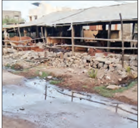
આ યોજના મંજૂર થઈ ત્યારથી જ જનતા તેનો વિરોધ કરી રહી હતી. શહેરના સાંકડા રસ્તાઓ, અગાઉથી કાર્યરત સેપ્ટિક ટેન્કો અને અન્ય પાઇપલાઇનો વચ્ચે ફરી નવી કુંડીઓ અને ઘર-ઘરે કનેક્શન અપાતા આખું નેટવર્ક ખોરવાઈ ગયું છે. સાંકડી

પ્લાસ્ટિક અને ઉભરાતી ગટરોના કારણે પ્રજા પ્રાહિમામ; વિજીલન્સ તપાસની ઉઠતી માગ માણવદર, તા. ૨૯ : માણવદર શહેરમાં કરોડોના ખર્ચે બનેલી ભૂગર્ભ ગટર યોજના સ્થાનિક રહીશો માટે આશીર્વાદને બદલે શ્રાપ સાબિત થઈ રહી છે. પાલિકા દ્વારા દર મહિને લાખો રૂપિયાનો ધૂમ ખર્ચ કરવામાં આવતો હોવા છતાં, શહેરના મુખ્ય માર્ગો અને સોસાયટીઓમાં ગટરના ગંદા પાણી ઉભરાઈ રહ્યા છે. આ દૂષિત પાણીના કારણે સમગ્ર પંથકમાં ભયાનક રોગચાળો ફાટી નીકળવાની દહેશત પ્રવર્તી રહી છે. સ્થાનિક લોકોના જણાવ્યા અનુસાર, માણવદરમાં જ્યારે જગ્યાઓમાં પાઇપલાઇનો ભેગી થઈ જતાં પીવાના શુદ્ધ પાણીની લાઈનમાં ગટરનું ગંદુ પાણી ભળી જવાની ગંભીર ઘટનાઓ પણ સામે આવી રહી છે, જે માનવ જિંદગી સાથે મુલ્કેઆમ ચેડા સમાન છે. પ્રજામાં એવી ચર્ચા ચાલી રહી છે કે, સરકાર આ સમગ્ર ભૂગર્ભ ગટર યોજનાની નિષ્ફળ વિજીલન્સ તપાસ કરાવે. જનતા હવે આ યોજના બંધ કરી મોટી પુલ્લી ગટરો બનાવવાની માંગ કરી રહી છે. એક તરફ શહેરમાં પ્લાસ્ટિક અને ગંદકીનું સામ્રાજ્ય વધી રહ્યું છે, ત્યારે બીજી તરફ નગરપાલિકામાંથી અચાનક જ ૪૦ જેટલા સફાઈ કર્મચારીઓને ક્યા કારણોસર છૂટા કરવામાં આવ્યા? તેવો મોટો પ્રશ્ન ઊભો થયો છે. કર્મચારીઓની ઘટને કારણે સફાઈ કામગીરી સંપૂર્ણપણે ખોરવાઈ ગઈ છે.