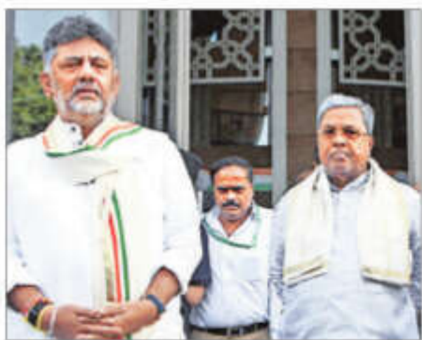
Karnataka CM Siddaramaiah (right) and Deputy CM DK Shivakumar leave after attending a party meeting at Indira Bhavan, in New Delhi on Tuesday

While the Congress asked the media to stop speculating, it did not specify