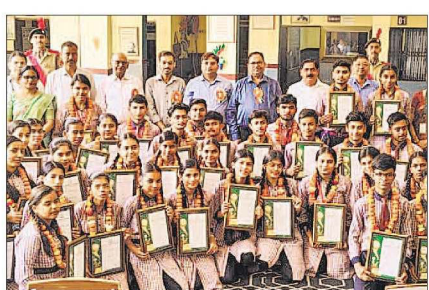
स्वरूपी देवी मेमोरियल इंटर कॉलेज में सम्मान समारोह में सम्मानित हुए छात्र-छात्राएँ।