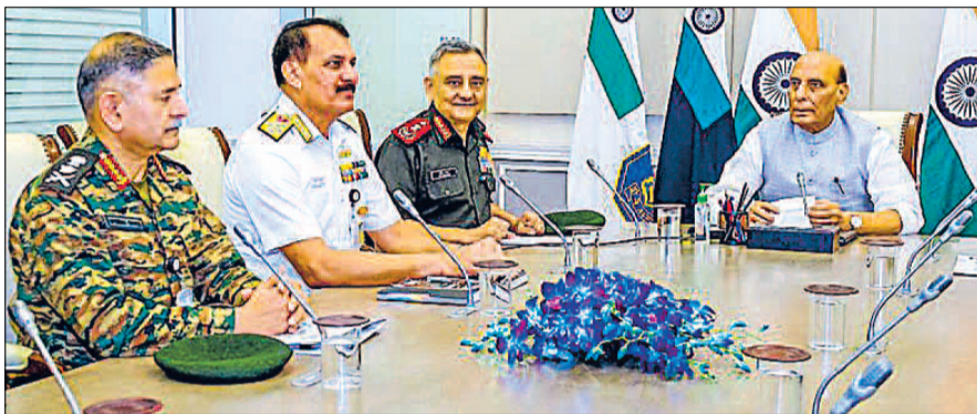
नई दिल्ली में मंगलवार को उच्चस्तरीय बैठक में मौजूद रक्षा मंत्री राजनाथ सिंह और तीनों सेनाओं के अधिकारी।

बैठक से जुड़े अधिकारियों ने बताया कि इस दौरान वेस्टर्न फ्रंटियर में सुरक्षा व्यवस्था और मौजूदा हालात को लेकर कई बिंदुओं पर चर्चा हुई। बैठक में प्रमुख चीफ एडमिरल दिनेश कुमार त्रिपाठी और रक्षा सचिव राजेश कुमार सिंह मौजूद थे। सूत्रों का कहना है कि बैठक में सैन्य अधिकारियों ने भारत-पाक से लगती सीमा पर मौजूदा हालात की भी जानकारी दी और हर स्थिति से