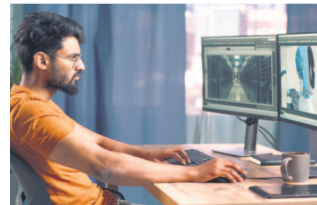
AI betters production quality and output, but content creators need to work on storytelling and audience engagement.