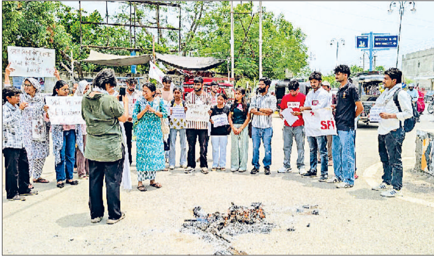
हिसार। केंद्रीय शिक्षा मंत्री धर्मेंद्र प्रधान के सांकेतिक पुतले को जलाते एसएफआई के कार्यकर्ता।