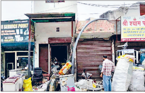
हिसार। अतिक्रमण न करने की हिदायत देते निगम कर्मी।

शहर को अतिक्रमण मुक्त बनाने के लिए नगर निगम का विशेष अभियान लगातार जारी है। मंगलवार को निगम टीम ने मलिक चौक से एचएच 2 नंबर गेट तक अतिक्रमण से अभियान की शुरुआत की। इसके बाद टीम ने घोड़ा फार्म रोड पर एक दुकानदार के द्वारा सड़क किए गए अतिक्रमण हटाने की कार्रवाई के साथ दुकानदारों के सामान भी जल किए गए।