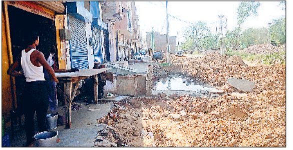
आदमपुर। जवाहर नगर साइड में रेलवे द्वारा बनाई जा रही दीवार के मध्य की गई खुदाई तथा टूटी पाइपलाइन

आदमपुर के जवाहर नगर इलाके में रेलवे द्वारा बनाई जा रही सुरक्षा दीवार स्थानीय निवासियों के लिए जी का जंजाल बन गई है। इस दीवार के निर्माण से गुस्साए और परेशान लोगों ने करीब एक महीने पहले रास्ता देने और निर्माण कार्य रोकने की मांग को लेकर जोरदार धरना-प्रदर्शन भी किया था। स्थानीय लोगों ने प्रदेश के मुख्यमंत्री नायब सिंह सैनी, जिला अधिकारियों और जनप्रतिनिधियों से न्याय की गुहार लगाई थी और रेलवे विभाग को ज्ञापन भी सौंपा था। लेकिन प्रशासन और विभाग की तरफ से फिलहाल कोई राहत मिलती नजर नहीं आ रही है। दीवार शुरु हुई खुदाई, टूटी पेयजल पाइपलाइन रेलवे विभाग द्वारा एक बार फिर दीवार निर्माण के लिए खुदाई का काम शुरू कर दिया