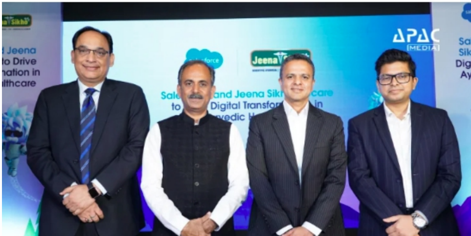
Salesforce, Jeena Sikho Lifecare Partner to Drive Digital Transformation in Ayurvedic Healthcare

September 11, 2025 in Healthcare & Wellbeing, HealthTech Reading Time: 2 mins read