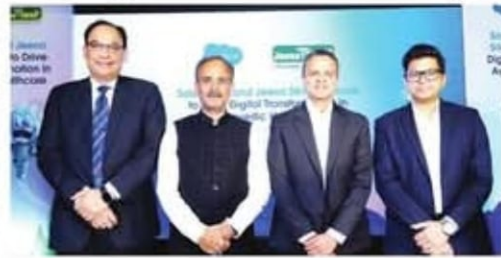
PUNJAB EXPRESS BUREAU Chandigarh, September 11

Salesforce, the #1 AI CRM*, on Thursday announced its collaboration with Jeena Sikho Lifecare, a leading Ayurvedic healthcare and wellness company, to accelerate its digital transformation and enhance patient care. This collaboration leverages Salesforce's AI-driven solutions to streamline operations, optimise patient engagement and expand access to holistic healthcare through digital platforms.