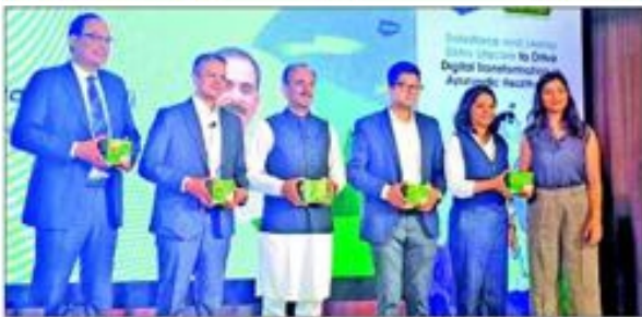
जीना सीखो लाइफकेयर और सेल्सफोर्स के साथ हुए समझौते के दौरान अतिथि। संवाद