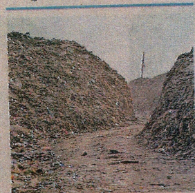
भाऊ सिंह स्थित निस्तारण प्लांट में कूड़े के लगे पहाड़

नगर निगम कार्यकारिणी की आज की बैठक में शर्तों के साथ रखा जाएगा प्रस्ताव, सदन की स्वीकृति पर जाएगा शासन