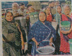
जुही में पानी को लेकर प्रदर्शन करते क्षेत्रीय निवासी • क्षेत्रीय निवासी

जागरण संवाददाता, कानपुर: गंगा बैराज प्लांट से दो मई तक दक्षिण के मुहल्लों में जलापूर्ति बंद की गई थी लेकिन पांच मई तक जलापूर्ति नहीं होने से लोगों में आक्रोश है। परेशान क्षेत्रीय लोगों ने बाल्टी लेकर प्रदर्शन किया।