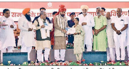
कुरुक्षेत्र। भूमि प्राप्ता प्रमाण पत्र वितरित करते मुख्यमंत्री नाथ सिंह सैनी।

हरियाणा के मुख्यमंत्री नाथ सिंह सैनी ने प्रजापति समाज से आह्वान किया कि वे अपनी पारंपरिक कला को आधुनिक तकनीक से जोड़ते हुए उसे और सशक्त बनाएं। साथ ही, सरकारी योजनाओं का लाभ उठाते हुए नई तकनीकों को अपनाकर एवं अपने उत्पादों की गुणवत्ता एवं आकर्षण बढ़ाकर बाजार की मांग के अनुरूप कार्य करते हुए आगे बढ़ें।