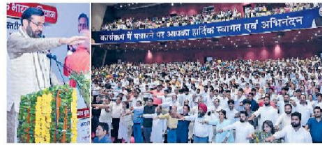
हरिभूमि न्यूज़ ▶▶ चंडीगढ़

माता-पिता बच्चों को समय दें, ताकि बच्चे रास्ता न भटकें