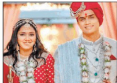
दिवशा और समर्थ की फाइल फोटो।

मीडिया से घटनाक्रम की रिपोर्टिंग के समय संयम बरतने को कहा