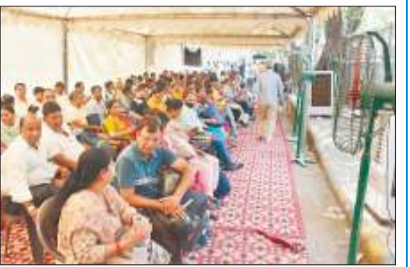
कूलिंग जोन में बैठे अभिभावक।

नई दिल्ली: रविवार को नीट यूजी परीक्षा के दौरान परीक्षार्थियों और उनके अभिभावकों की सुविधा के लिए दिल्ली सरकार द्वारा किए गए विशेष प्रबंधों को सराहा गया। लगभग 45,000 अभिभावकों व परीक्षार्थियों ने दिल्ली सरकार की इस सुविधा का लाभ उठाया।