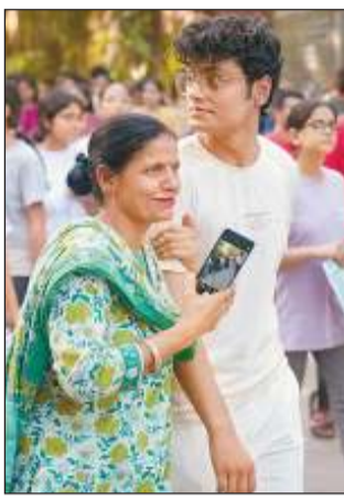
परीक्षा देकर केंद्र से बाहर आए छात्र खुश दिखाई दिए।