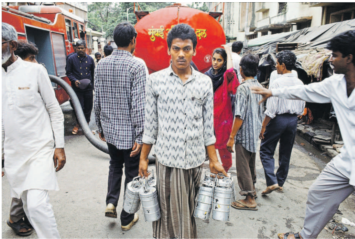
(Above) Raghubir Singh, 'Dabbawallah, or professional lunch distributor, Bombay', 1992; (top right) 'Crawford market, Bombay', 1993; (right) 'Victoria Terminus, Bombay', 1991.

For someone photographing the 'Mumbai' of now, the encounter with Singh's images is never neutral. I recognise these pictures and I do not. In Playing 'Punishment', a marble game, Bombay