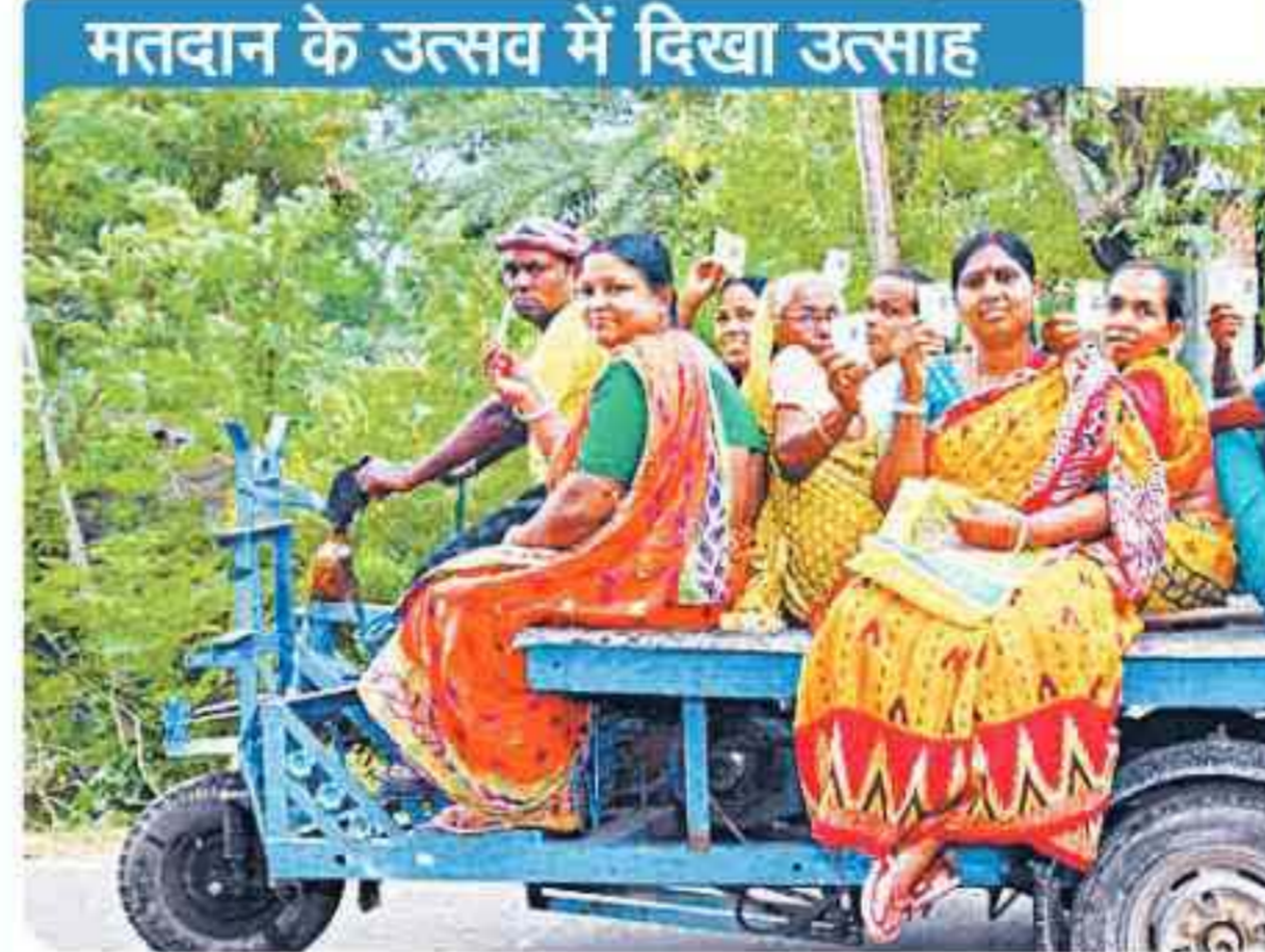
ये उत्साह कुछ कहता है... पश्चिम बंगाल के उत्तर 24 परगना में तिपहिया जुगाड़ में मतदान के लिए जाते लोगों के चेहरे पर झलका लोकतंत्र का उत्सव।

गलत भी होते हैं एग्जिट पोल अनुमान देश में एग्जिट पोल अनुमानों का इतिहास मिला-जुला रहा है। कई बार एग्जिट पोल अनुमान असली नतीजों के आसपास रहे, लेकिन कई महत्वपूर्ण चुनावों में एग्जिट पोल पूरी तरह गलत साबित हुए। ■ आम चुनाव 2004: एग्जिट पोल में अटल बिहारी वाजपेयी के नेतृत्व में एनडीए की वापसी बताई गई, नतीजों में कांग्रेस-माई युपीए गठबंधन की जीत। ■ आम चुनाव 2024: अधिकतर एग्जिट पोल में भाजपा को पूर्ण बहुमत और एनडीए को 316 से 415 तक सीटें बताई गईं, असली नतीजों में एनडीए को 293 सीटें ही मिली। ■ हरियाणा विधानसभा चुनाव, 2024: अधिकतर एग्जिट पोल में भाजपा की हार और कांग्रेस की जीत बताई गई। असली नतीजों में भाजपा ने 90 में से 48 सीटें जीतकर शानदार हैट्रिक लगाई। ■ उत्तर प्रदेश विधानसभा चुनाव 2017: सभी एग्जिट पोल में त्रिशंकु विधानसभा की भविष्यवाणी की गई थी, असली नतीजों में भाजपा ने ऐतिहासिक 325 सीटें जीतीं। ■ दिल्ली विधानसभा चुनाव, 2015: एग्जिट पोल में आम आदमी पार्टी को साधारण बहुमत बताया, असली नतीजों में आप ने 70 में से 67 सीटें जीतीं।