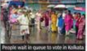
People wait in queue to vote in Kolkata

Barely 50m separated CM Mamata Banerjee and her ex-confidant and BJP challenger Suwendu Adhikari in a narrow Bhowanipore lane. Neither acknowledged the other nor exchanged a glance.