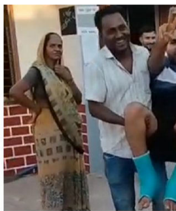
સાવલી તાલુકામાં સ્થાનિક સ્વરાજ્યની ચૂંટણીમાં મતદારો ભારે નિરાસા જણાઈ રહ્યા હતા અને મતદાન મથકો પર એકલ દોકલ મતદારો જણાતા હતા જોકે સાંજના સમયે મતદારો ઉમટી પડ્યા હતા અને શાંતિ પૂર્ણ વાતાવરણ ચૂંટણી સંપન્ન થઈ હતી

સાવલી તાલુકામાં સ્થાનિક સ્વરાજ્યની ચૂંટણીમાં મતદારો ભારે નિરાસા જણાઈ રહ્યા હતા અને મતદાન મથકો પર એકલ દોકલ મતદારો જણાતા હતા જોકે સાંજના સમયે મતદારો ઉમટી પડ્યા હતા અને શાંતિ પૂર્ણ વાતાવરણ ચૂંટણી સંપન્ન થઈ હતી. સાવલી તાલુકામાં આજે નગરપાલિકા તેમજ તાલુકા પંચાયત અને જિલ્લા પંચાયત માટે મતદાન થયું હતું જેમાં મતદારોની કંટારો જોવા મળી ન હતી. ગરમીના કારણે સાંજના સમયે મતદારોની ભીડ મતદાન મથકો પર જોવા મળી હતી તાલુકા પંચાયત