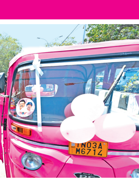
உலக மகளிர் தினத்தையொட்டி சென்னை நேரு உள்விளையாட்டு அரங்கத்தில் இன்று நடந்த விழாவில், முதல்வர் மு.க.ஸ்டாலின், 100 இளஞ்சிவப்பு நிற ஆட்டோக்களை மகளிர் பயனாளிகளுக்கு வழங்கி உரையாடினார்.

சென்னை, செங்கல்பட்டு, காஞ்சிபுரம், திருவள்ளூர் ஆகிய மாவட்டங்களில் செயல்பட்டுகிற 250 பெண்களுக்கு 'பிங்க்' ஆட்டோக்களை வழங்கி உரையாடினார். பெண்களை, செங்கல்பட்டு, காஞ்சிபுரம், திருவள்ளூர் ஆகிய மாவட்டங்களில் செயல்பட்டுகிற 250 பெண்களுக்கு 'பிங்க்' ஆட்டோக்களை வழங்கி உரையாடினார். பெண்களை, செங்கல்பட்டு, காஞ்சிபுரம், திருவள்ளூர் ஆகிய மாவட்டங்களில் செயல்பட்டுகிற 250 பெண்களுக்கு 'பிங்க்' ஆட்டோக்களை வழங்கி உரையாடினார்.