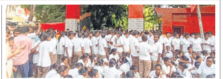
Women recruits on dharna

double the number of trainees into the barracks, and allowing instructors to humiliate them during inspections. One of the protesting