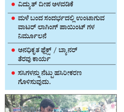
ರಸ್ತೆ ಬದಿ ಬಿದ್ದ ಮರವನ್ನು ತೆರವುಗೊಳಿಸುತ್ತಿರುವ ಪಾಲಿಕೆ.