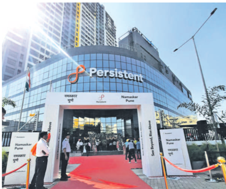
Persistent Systems recorded a 4.16% jump in revenue to $375.2 billion in Q4.

Cognizant is considered an Indian-heritage IT firm as more than three-fourths of its workforce is stationed in