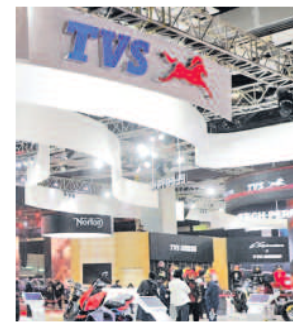
TVS Motor acquired Norton in 2020 in an all-cash deal for ₹153 crore.

have been making losses with the bulk of the losses booked in Norton and SEMG." Norton was acquired by the Hosur-based company in 2020 in an all-cash deal for ₹153 crore. Since taking over the motorcycle brand, TVS has invested more than ₹1,000 crore into the company. In 2021, it opened a new plant in Solihuli, UK, with a capacity to produce around 8,000 motor-