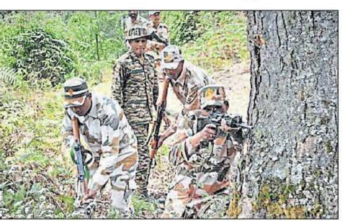
पहलगांम हमले के बाद पाक से तनातनी के बीच संयुक्त अभ्यास करते सुरक्षाबल।

नई दिल्ली/श्रीनगर, एजेंसी। पहलगांम हमले के बाद पाकिस्तान से तनातनी के बीच सुरक्षाबलों का 'संयुक्त अभ्यास' शुरू हो गया है। भारतीय सेना की त्रिशक्ति कॉर्प्स ने मंगलवार को एक्स पर तस्वीर साझा करते हुए कहा कि भारतीय सेना और अर्धसैनिक बलों ने संयुक्त सैन्य अभ्यास किया।