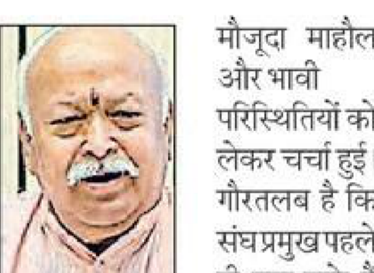
मौजूदा महाल और भावी परिस्थितियों को लेकर चर्चा हुई। गौरतलब है कि संघ प्रमुख पहले ही कह चुके हैं कि आतंकीयों को उन्हीं की भाषा में जवाब देना चाहिए और राजा का धर्म अपनी प्रजा को रक्षा करना है। इससे संघ प्रमुख मोहन भागवत ने प्रधानमंत्री नरेंद्र मोदी को साफ कर दिया था कि वह अपनी कार्रवाई आगे बढ़ाएं।

नई दिल्ली, विशेष संवाददाता। पहलगांम आतंकी हमले के बाद सरकार की भावी कार्रवाई के पहले राष्ट्रीय स्वयंसेवक संघ के प्रमुख मोहन भागवत ने मंगलवार को प्रधानमंत्री नरेंद्र मोदी से मुलाकात की।