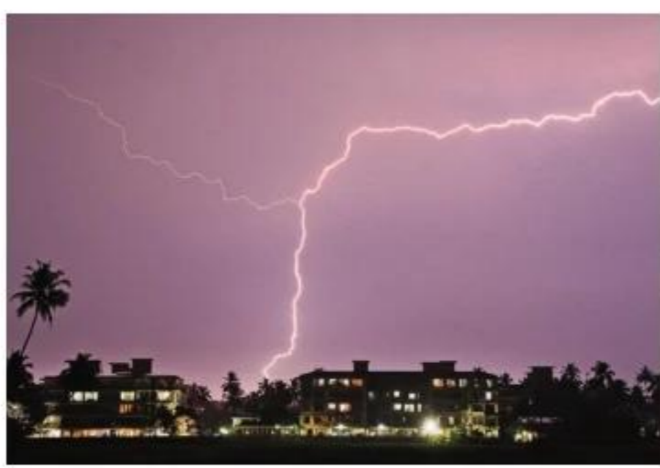
Top 5 States With Most Deaths By Lightning

Incidentally, analysis of lightning deaths over two decades shows that