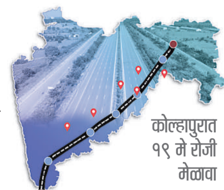
कोल्हापुरात १९ मे रोजी मेळावा

आणि जवळ या दोन गावांच्या शेतकऱ्यांनी शक्तिपीठ महामार्गाला प्रखर विरोध केला होता. हजुरा शेतकरी रस्त्यावर उतरले होते. शासनाने ही दोन्ही गावे शक्तिपीठ