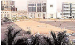
‘महाराष्ट्र प्रदूषण नियंत्रण मंडळ’ला ‘पर्यावरण भवन’च्या उभारणीसाठी एमएमआरडीएकडून भूखंड वाटप करण्यात आले आहे.

मुंबई : आंतरराष्ट्रीय दर्जाच्या वांद्रे-कुर्ला संकुलातील नऊ भूखंडांचा ई-लिलाव करण्याचा निर्णय मुंबई महानगर प्रदेश विकास प्राधिकरणाचे (एमएमआरडीए) घेतला आहे. यासाठी निविदा प्रसिद्ध करण्यात आली असून, या ई-लिलावातून एमएमआरडीएला किमान ९,२०० कोटी रुपयांचा महसूल मिळण्याची शक्यता आहे.