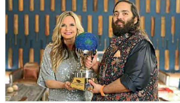
अमेरिका : वन्यजीवांच्या कार्यासाठी अनंत अंबानी यांचा 'ग्लोबल ह्यूमॅनिटेरियन अवॉर्ड'ने सन्मान करण्यात आला.

अमेरिकेतील आंतरराष्ट्रीय समारंभात सन्मानित