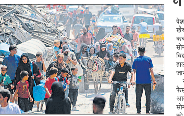
दक्षिणी गाजा पट्टी से सुरक्षित स्थानों की ओर जाते फलस्तीनी।

दीर अल-बलाह (गाजा पट्टी), एजेंसी। इजरायली सेना ने गाजा पट्टी में उस हिस्से को खाली करने का सोमवार को आदेश दिया जिसे उसने मानवीय क्षेत्र घोषित किया था। सेना ने कहा कि वह इस क्षेत्र में छिपे हथियारों के आतंकवादियों के खिलाफ बड़ा अभियान शुरू करने की योजना बना रही है। इस महीने की शुरुआत में, इजरायल ने कहा था कि उसका अनुमान है कि कम से कम 18 लाख फलस्तीनी अब मानवीय क्षेत्र में हैं। उसने भूमध्य सागर के साथ लगते