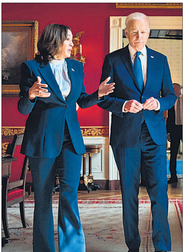
अमेरिकी राष्ट्रपति जो बाइडन के साथ उपराष्ट्रपति कमला हैरिस।

मस्क-खोसला में जुबानी जंग : ट्रंप की उम्मीदवारी पर एलन मस्क और भारतीय-अमेरिकी उद्यमी विनोद खोसला में जुबानी जंग छिड़ गई। एक्स पर खोसला ने ट्रंप को ऐसा रिपब्लिकन नेता करार दिया, जिसमें 'कोई नैतिकता नहीं है, जो झूठ बोलता है, दुष्कर्मी में शामिल है। मस्क ने कहा, 'ट्रंप आपसे नफरत नहीं करते हैं। उनसे मिलिए और अपने बारे में उनके विचार जानिए।