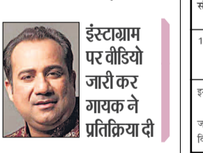
इंस्टाग्राम पर वीडियो जारी कर गायक ने प्रतिक्रिया दी

दुबई, एजेंसी। पाकिस्तानी गायक राहत फतेह अली खान ने सोमवार को दुबई में अपनी गिरफ्तारी की खबरों को खारिज किया। उन्होंने कहा कि ये खबरें फर्जी और निराधार हैं। उन्होंने अपने इंस्टाग्राम पर वीडियो जारी कर ये प्रतिक्रिया दी है।