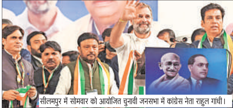
सीलमपुर में सोमवार को आयोजित चुनावी जनसभा में कांग्रेस नेता राहुल गांधी।

दिल्ली के सीलमपुर इलाके में आयोजित जनसभा में राहुल गांधी ने कहा कि दिल्ली में