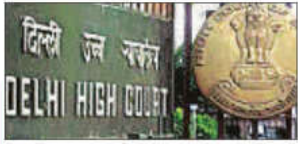
पर्यावरण संरक्षण, पारिस्थितिक संवेदनशीलता के लिए लिया गया निर्णय, डीडीए को सुर घाट पर प्रतिबंध लागू करने का निर्देश